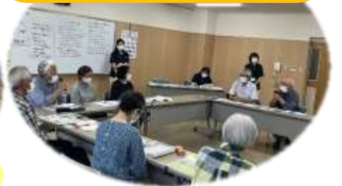
旧群馬町2地区協議体情報交換会（群馬さくら・なのはな）