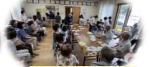
新高尾・中川（新高尾）

発行元：高崎市第1層生活支援コーディネーター 連絡先：☎：027-321-1319（高崎市長寿社会課）