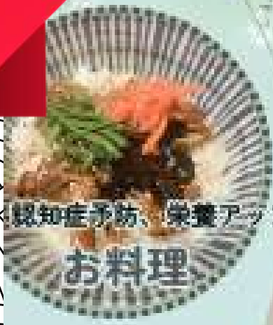
認知症予防、栄養アップ お料理