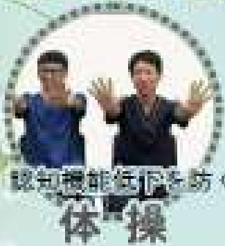
認知機能低下を防ぐ 体操