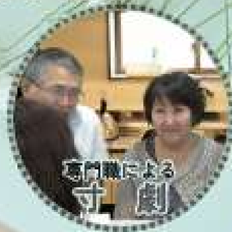
専門職による 寸劇