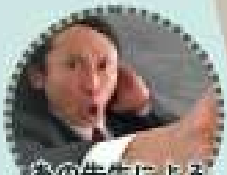
あの先生による サービス紹介