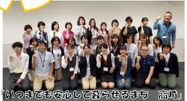
「いつまでも安心して暮らせるまち 高崎」を目指しています